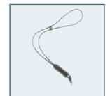
Leather Strap O-ST24