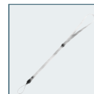
Sport Strap O-ST30